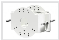
EDC-PM7-W | Artikelnummer: 220492